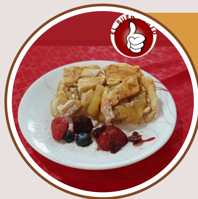
EMPANADA DE MANZANA $57.00

Cheesecake sin gluten sabor a elegir: Zarzamora Frambuesa Arandano Uva Fresa