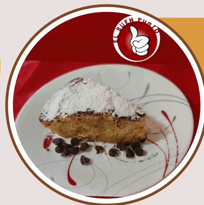
PASTEL DE NATA $55.00

Pastelillo de chocolate, sin gluten con nuez