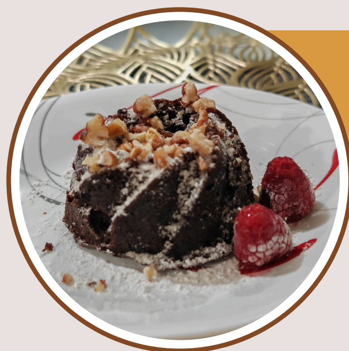
BROWNIE SIN GLUTEN $52.00

Empanada de hojaldre artesanal, rellena de manzana.